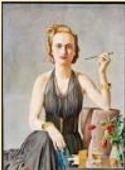
Pintura: Ricardo Rodríguez

PAPIRUSA: Dejando de lado el quechua, pasemos ahora al polaco, el que aparece en