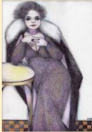
Pintura: Ricardo Rodríguez

china: criada doméstica, especialmente en casa de españoles; mujer plebeya.